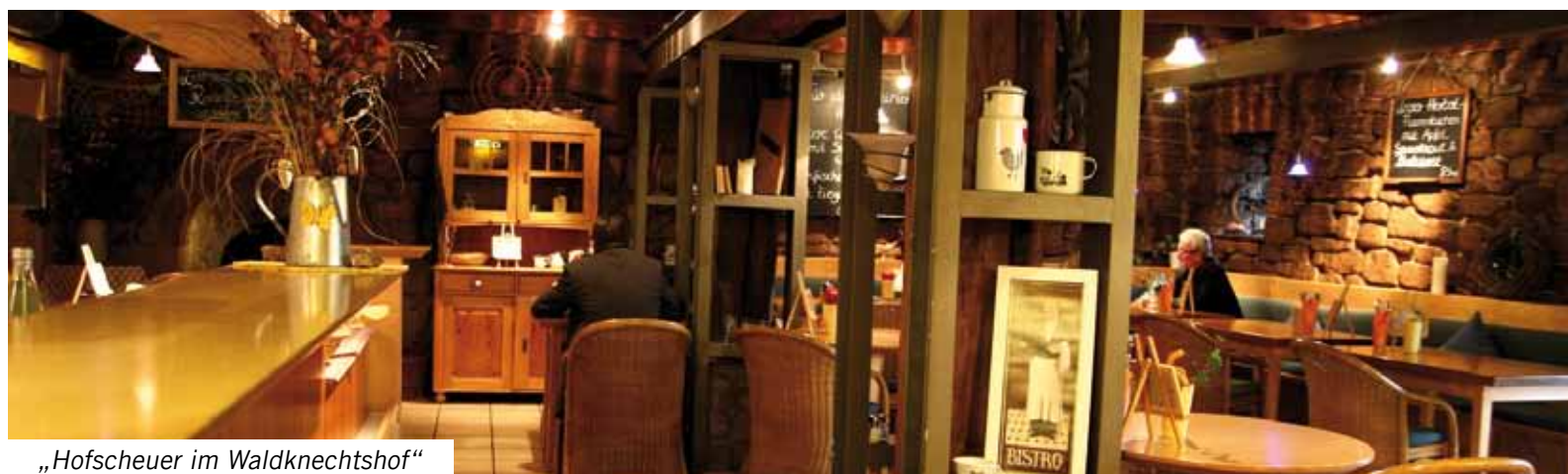
„Hofscheuer im Waldknechtshof“