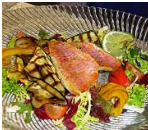
Rotbarbe auf Blattsalaten