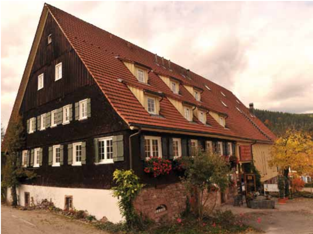
Waldknechtshof im Herbst