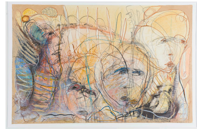
„Und was langes am Ohr“